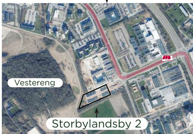
Kort over nærområde

Storbylandsby 2 ligger på Oluf Palmes Allé ved siden af den gamle Journalisthøjskole i Aarhus Nord ca. 4 km. fra centrum.